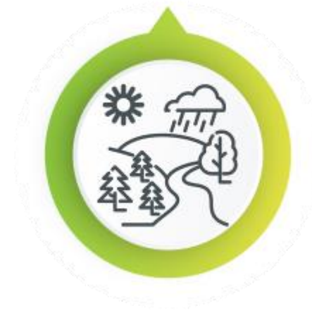
Биоразнообразие и ландшафт