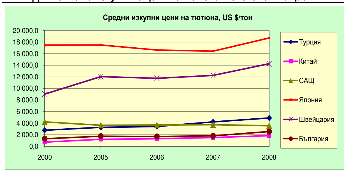
Фиг. 2 Движение на изкупните цени на тютюна в световен мащаб