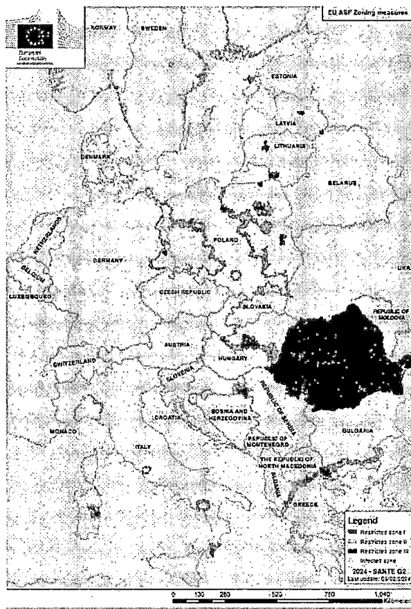
Карта 1: Регионализация във връзка с разпространението на АЧС в Европа в съответствие с последното изменение на Приложение I към Регламент (ЕС) 2023/594 (ОВ L 2024/483 от 06.02.2024 г.). Източник: DG SANTE.

епидемиологичната обстановка и се класифицират като ограничителни зони I (зони в риск), II (огнища при диви свине) и III (огнища при отглеждани (домашни) свине), като ограничителна зона III включва областите с най-високата степен на риск от разпространение и ограничителните мерки са най-тежки.