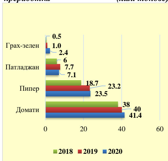
Графика 2 Пресни зеленчуци, доставени за преработка (хил. тонове)