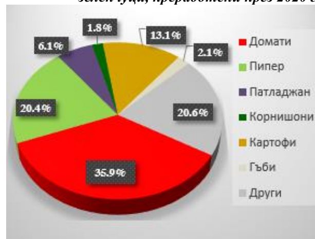
Графика 4 Относителен дял на пресните зеленчуци, преработени през 2020 г.